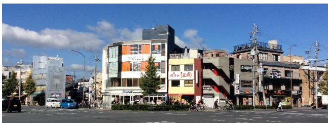
マクドナルド、セブン-イレブン、サイゼリア、王将、吉野家、すき家

京大といえば、一般の方々には、まず時計台が思い浮かぶと思いますが、京大で学生生活を送られたみなさまには、むしろ百万遍交差点をはじめとする京大周辺の空間の方がずっと日常的に大切に思い出深いのではないのでしょうか？ 京機短信No. 315(2018年7月 http://www.keikikai.jp/tanshin/tanshin_no315.pdf )では、タテカン撤去問題に関連して百万遍交差点の古い写真をご紹介しましたが、現在の姿は以下の4枚の写真（数学平面の第1象限から第4象限に対応させています）のようです。百万遍交差点は、かつて（1978年9月30日まで）市電が縦横に交差していたこともあり、「面取り」加工されて巨大な空間です。第2象限にあった1953年開店のパチンコ屋MONAKOは2016年4月30日に閉店しましたが、第1～3象限には、ファーストフードのチェーン店が勢ぞろいし、まさに京大生の街—百万遍を今風に象徴しているともいえます。一方、みずほ銀行百万遍支店は出町柳支店に統合されて、ATMだけが体育館前に残されたのは寂しく不便でもあります。