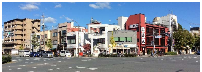
総代麺家あくた川、郵便局、じゃんぼ総本店、串八