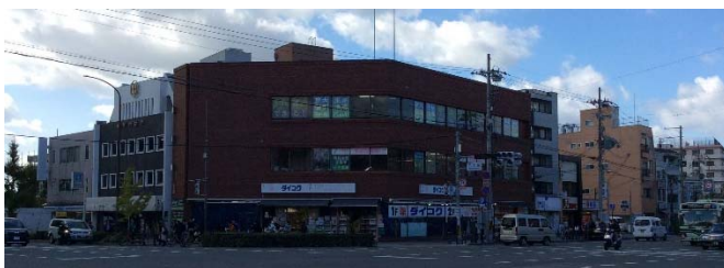
LAWSON、かぎや政秋、ダイコク、KFC、松屋、CoCo壱番屋