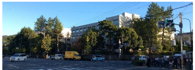
2018年5月には、タテカン撤去に対抗し皮肉った「ござっぱりとしてはる。」という名タテカンも

本連載では、そのような百万遍周辺のいくつかの地点にスポットライトを当ててみたいと思います。読者のみなさまの中には、筆者の付け焼刃的知識よりもっと詳しくご存じのところも多いと思いますが、逆に盲点となっているところも若干あるかもしれません。初回は、おそらく大多数のみなさまには後者ではないかと想像される公益財団法人 応用科学研究所（ https://www.rias.or.jp ）です。